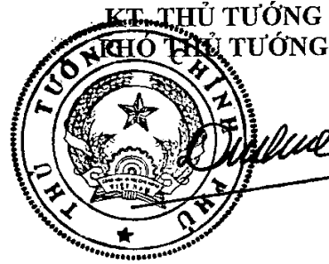
Vương Đình Huệ

Các Bộ trưởng, Thủ trưởng cơ quan ngang bộ, Thủ trưởng cơ quan thuộc Chính phủ, Chủ tịch Ủy ban nhân dân tỉnh, thành phố trực thuộc trung ương; Liên minh Hợp tác xã Việt Nam, Chủ tịch Hội đồng quản lý Quỹ Hỗ trợ phát triển hợp tác xã và các tổ chức, cá nhân khác có liên quan chịu trách nhiệm thi hành Quy chế này./.