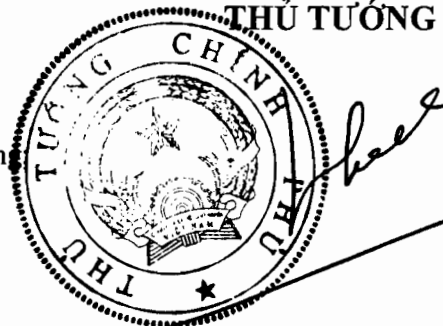
Nguyễn Xuân Phúc